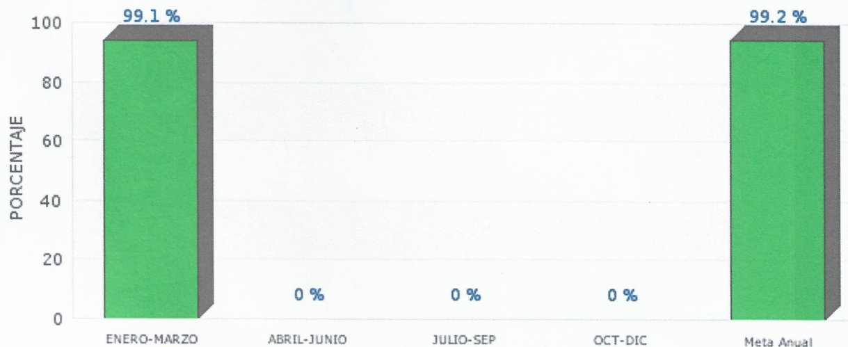
Gráfica de Indicador DE PERSONAS BENEFICIADAS RESPECTO A LA COBERTURA DE POBLACION