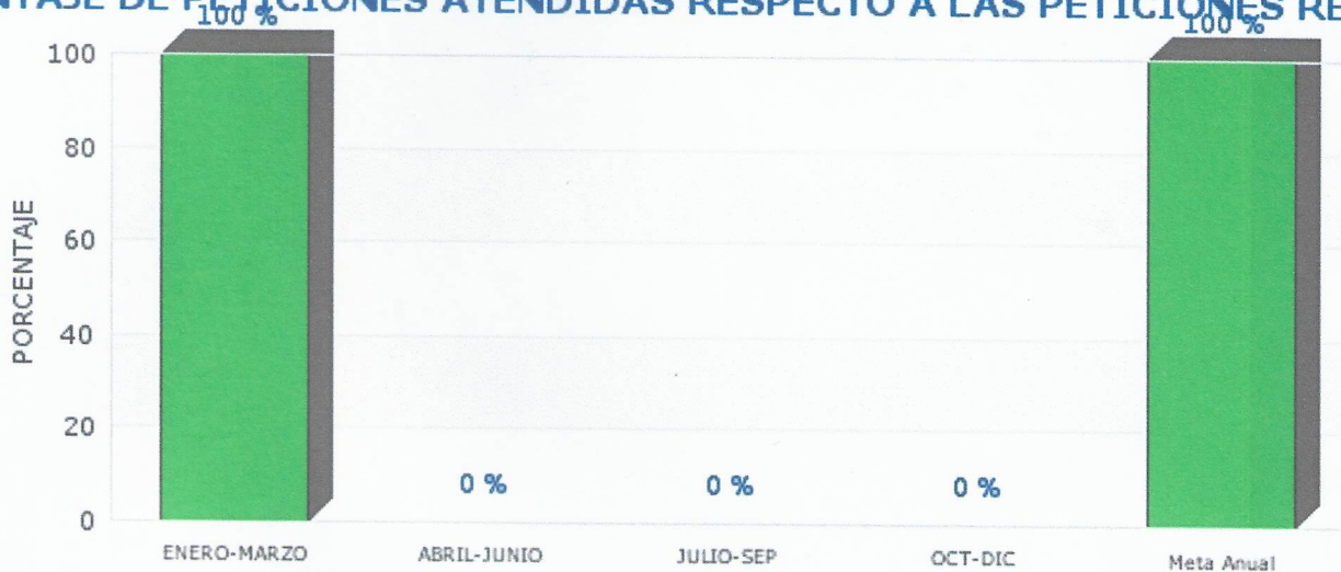
Gráfica de Indicador PORCENTAJE DE PETICIONES ATENDIDAS RESPECTO A LAS PETICIONES RECIBIDAS